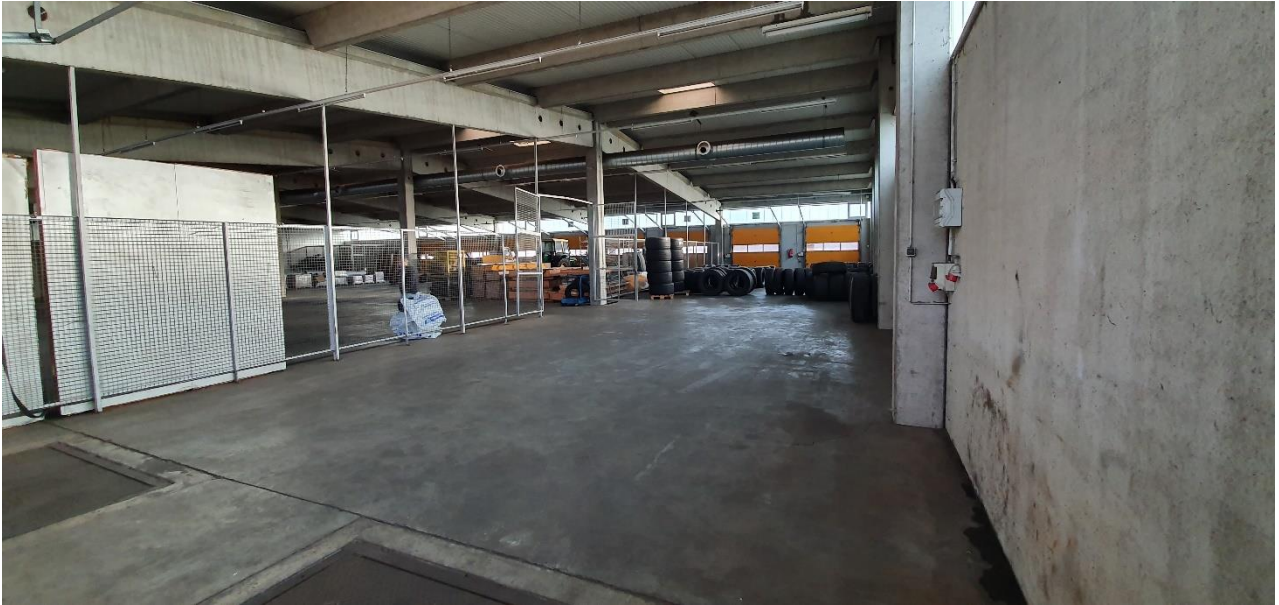
Anlage: Plan Lager- und Umschlaghalle Karl Fixemer GmbH & Co. KG - Auf dem Elm 2 - DE 66706 Perl-Borg